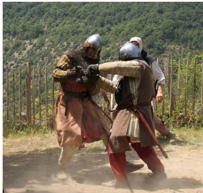
Démonstration de combat