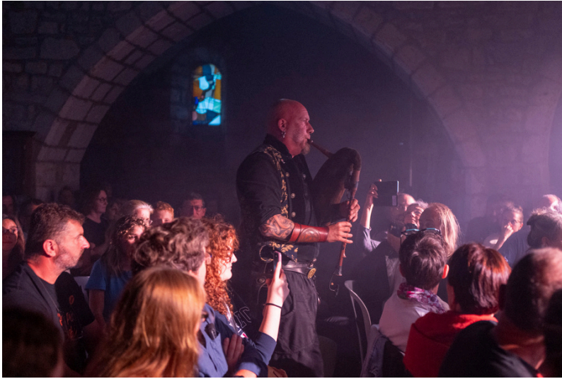
Concert de Luc Arbogast lors de l'inauguration

Après une inauguration fin juin marquée par deux concerts de Luc Arbogast, le nouvel espace muséographique a ouvert ses portes aux visiteurs début juillet !