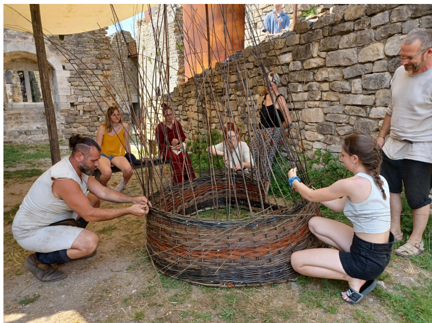
Vannerie collective d'une cabane en osier

Du 13 juillet au 25 août ont eu lieu les animations de l'Été à la forteresse, réparties sur le site. Chantier médiéval, armement médiéval, vannerie, forge, tour à bois... sans oublier les visites guidées quotidiennes ainsi que les nocturnes. Merci à tous nos visiteurs !!